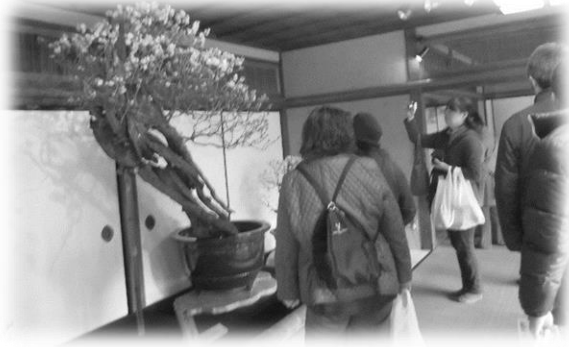
樹齢を重ねた見事な盆梅はどれも息をのむ美しさ

「道の駅近江母の郷」で美味しい昼食をいただいた後は、「ラコリーナ近江八幡」と「近江の町と寺社」のコースに分かれて見学を行いました。