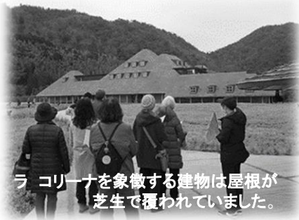
ラコリーナを象徴する建物は屋根が芝生で覆われていました。

美味しいバームクーヘンや和菓子と特徴的な建物が人気の「ラコリーナ近江八幡」では施設内の見学ツアーに参加。施設内全てに