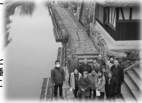
八幡堀で皆で記念撮影

「近江の町と寺社」コースでは八幡山のふもとにある、日牟礼八幡宮(ひむれはちまんぐう)を訪ねた後、八幡山をロープウェイで登り、近江の街を一望しました。それから、風情のある、また映画ロケ地としても有名な八幡堀を散策し、近江の歴史を学ぶ時間となりました。